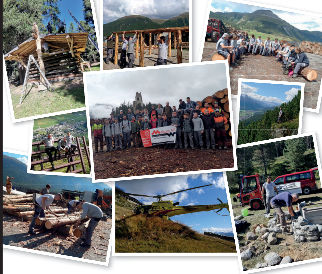
Impressionen aus unserem Lehrlingscamp

Die Melcom AG ist seit über 25 Jahren Spezialistin in den Bereichen Stark- und Schwachstrom. Und das mit grossem Erfolg. Wir legen sehr viel Wert auf qualitativ hochstehende Arbeit. Aufgaben und Projekte packen wir mit Wissen, Erfahrung, gesundem Menschenverstand und viel Leidenschaft an. Daraus resultieren Elektro- und IT-Lösungen, die rundum stimmig sind.